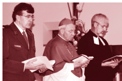
Sitten, Anfang Advent 2011 + Norbert Brunner Bischof von Sitten

In diesem Sinne eine gesegnete Adventszeit und ein schönes gnadenreiches Weihnachtsfest!